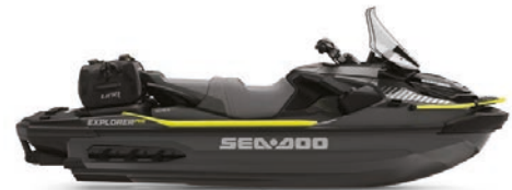
● Iceland Grey