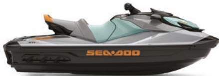
GTI™ SE 170