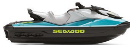
GTI™ SE 170