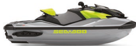
● NUEVO Hielo metalizado / Verde manta