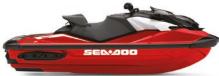
● NOVEDAD Rojo ardiente prémium